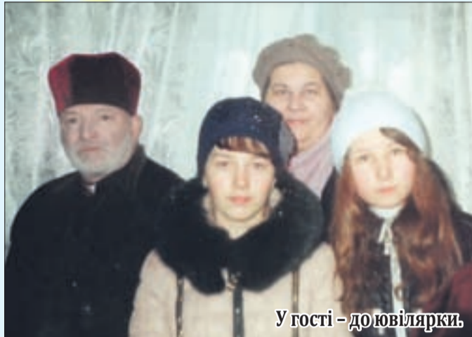
У гості – до ювілярки

спогади минувшини, немов на тім рушникові все знайоме... і кожна радісна мить.